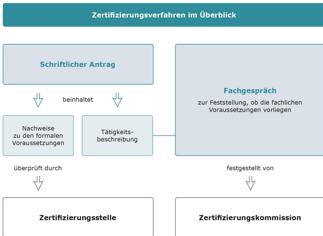
Abbildung 1: Zertifizierungsverfahren im Überblick